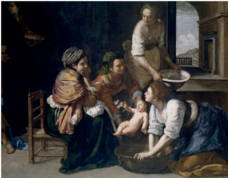
Artemisia Gentileschi "Nascita di san Giovanni Battista"

Che cosa ci indica allora Giovanni Battista con la sua nascita? Anzitutto i suoi anziani genitori, Elisabetta e Zaccaria, rassegnati ormai a una vita definitivamente sterile, senza speranza, nella quale però inaspettatamente irrompe Dio, ci indica i loro dubbi, le loro fatiche ma anche alla fine la loro accettazione gioiosa, perché in Dio c'è sempre speranza. Ci indica la cerchia di familiari e parenti legati alle loro irrinunciabili tradizioni, chiusi al